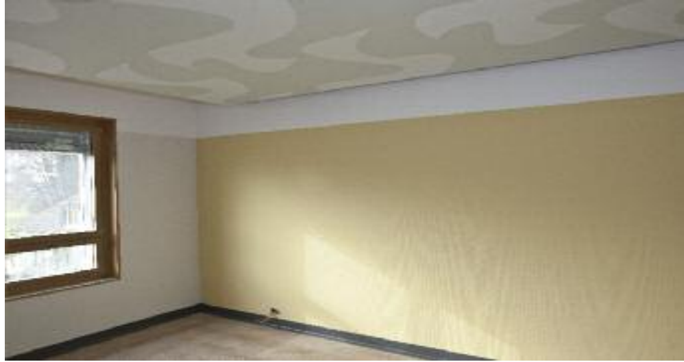
Nicht einfach weiss: Ein Zimmer im Erweiterungsbau 3.

Beim soeben vollendeten Neubau ist wiederum ein weiterer Schritt in der Entwicklung zu erkennen. In den Vordergrund ist nun die Wohnlichkeit gerückt. So wurde der Vorraum zu den Zimmern offen gestaltet, so dass eine Art Eingangportal zu den privaten Räumen entstand. Ausserdem dienen die Wandschränke in den Zimmern als optische Trennung des privaten Bereiches der Bewohner.