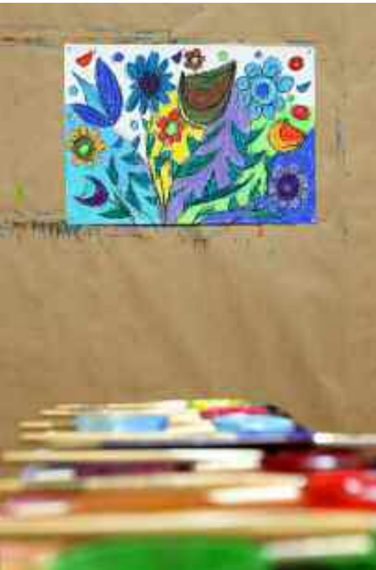
Im Malatelier der Sonnweid.

Beim Ausdrucksmalen oder in der Musiktherapie geht es nicht darum, professionell Musik zu machen oder Kunst im herkömmlichen Sinn hervorzubringen. Vielmehr handelt es sich um betreuerische Begleitformen, die kreativ-intuitive Impulse setzen und die Lebensqualität demenzkranker Menschen erhöhen möchten. Ein Augenschein im Krankenhaus Sonnweid sowie im Zürcher Waidspital hat gezeigt, wie sich den Menschen mit Demenz im Umgang mit Farben und Klängen neue Möglichkeiten der Kommunikation und des emotionalen Ausdrucks eröffnen.