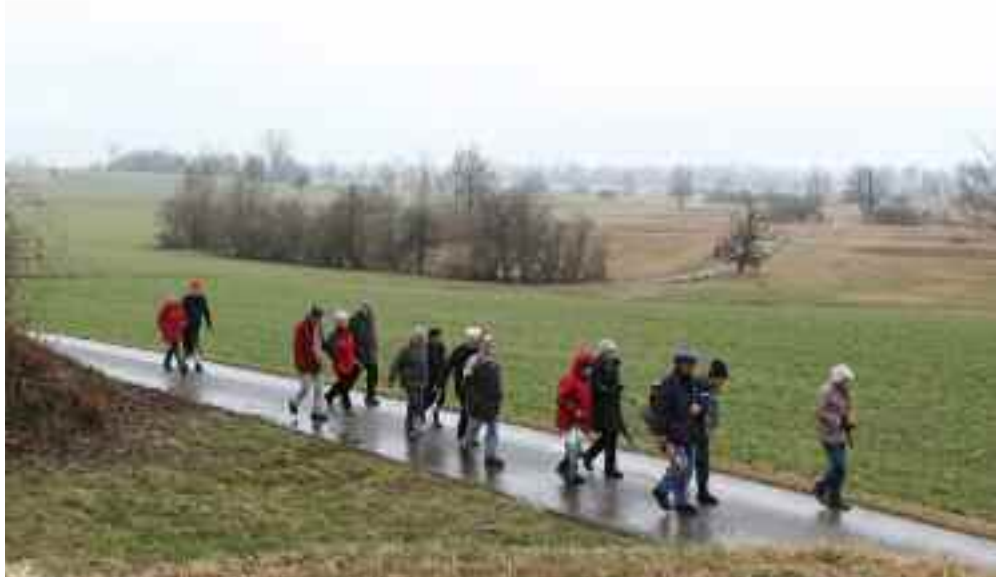
Die Wandergruppe der Sonnweid zwischen Auslikon und Römerkastell.