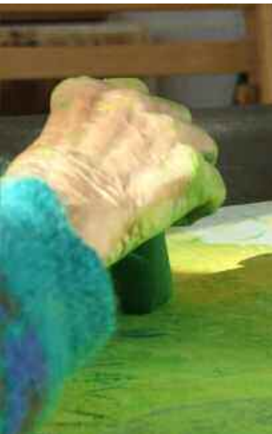
Die Ausstellung zeigt das schöpferische Potenzial von Menschen mit Demenz.

Nein, Kunst kann Demenz nicht aufhalten. Aber Kunst kann entstehen – trotz Demenz. Kunst kann helfen, Gefühle und Stimmungen zum Ausdruck zu bringen, die sich anders nicht mehr äussern können. Im künstlerischen Tun werden